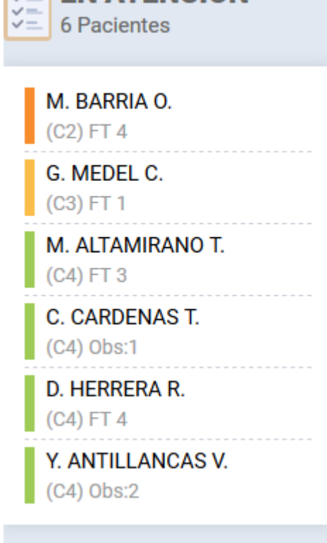
Ilustración1.5.1: Pantalla rotativa 2- pacientes en atención