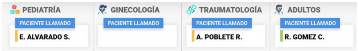
Ilustración1.3: Descripción áreas de atención en urgencias

Dependiendo el área de atención se van asignando pacientes que se reflejan en la parte inferior de cada área (Ilustración1.3: Descripción áreas de atención en urgencias), donde se visualiza al último paciente llamado por el profesional médico para ser evaluado.