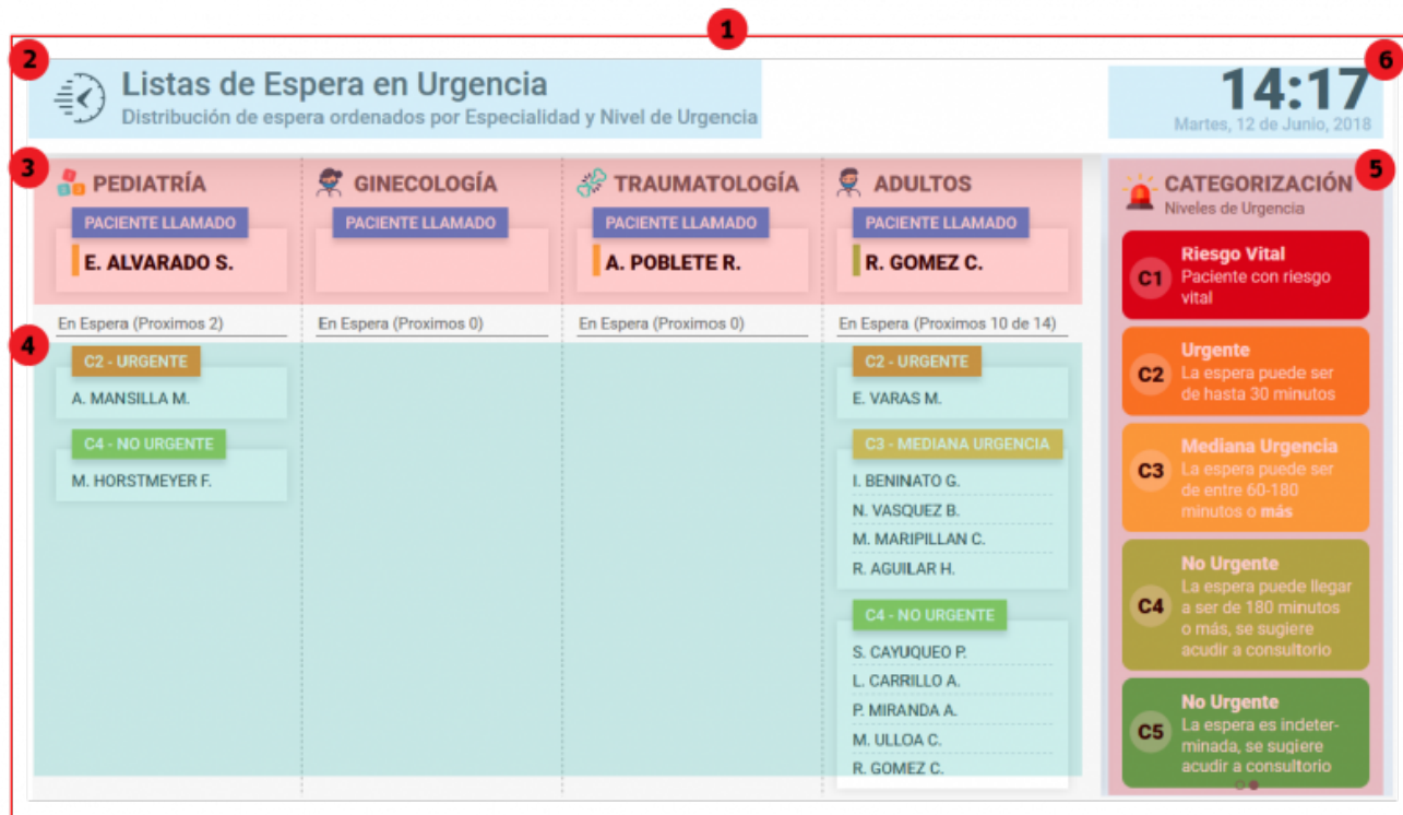
Ilustración1.0: Pantalla General con identificación