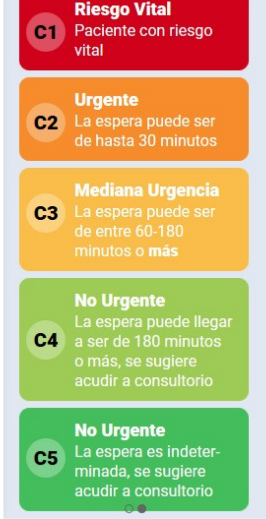
Ilustración1.5: Pantalla rotativa 1 – Categorías